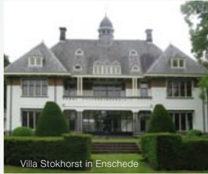
Villa Stokhorst in Enschede

De plannen voor vernieuwing van het centrum zijn in nauw overleg met buurtbewoners en belanghebbenden voorbereid. Met de gemeente Enschede is overeenstemming bereikt over de stedenbouwkundige opzet. Inmiddels zijn de bouwvergunningen aangevraagd en verwachten wij na verkoop van 70% van de appartementen in 2010 te kunnen starten met de bouw van Erve Weldink. De bestemmingsplanprocedure loopt.