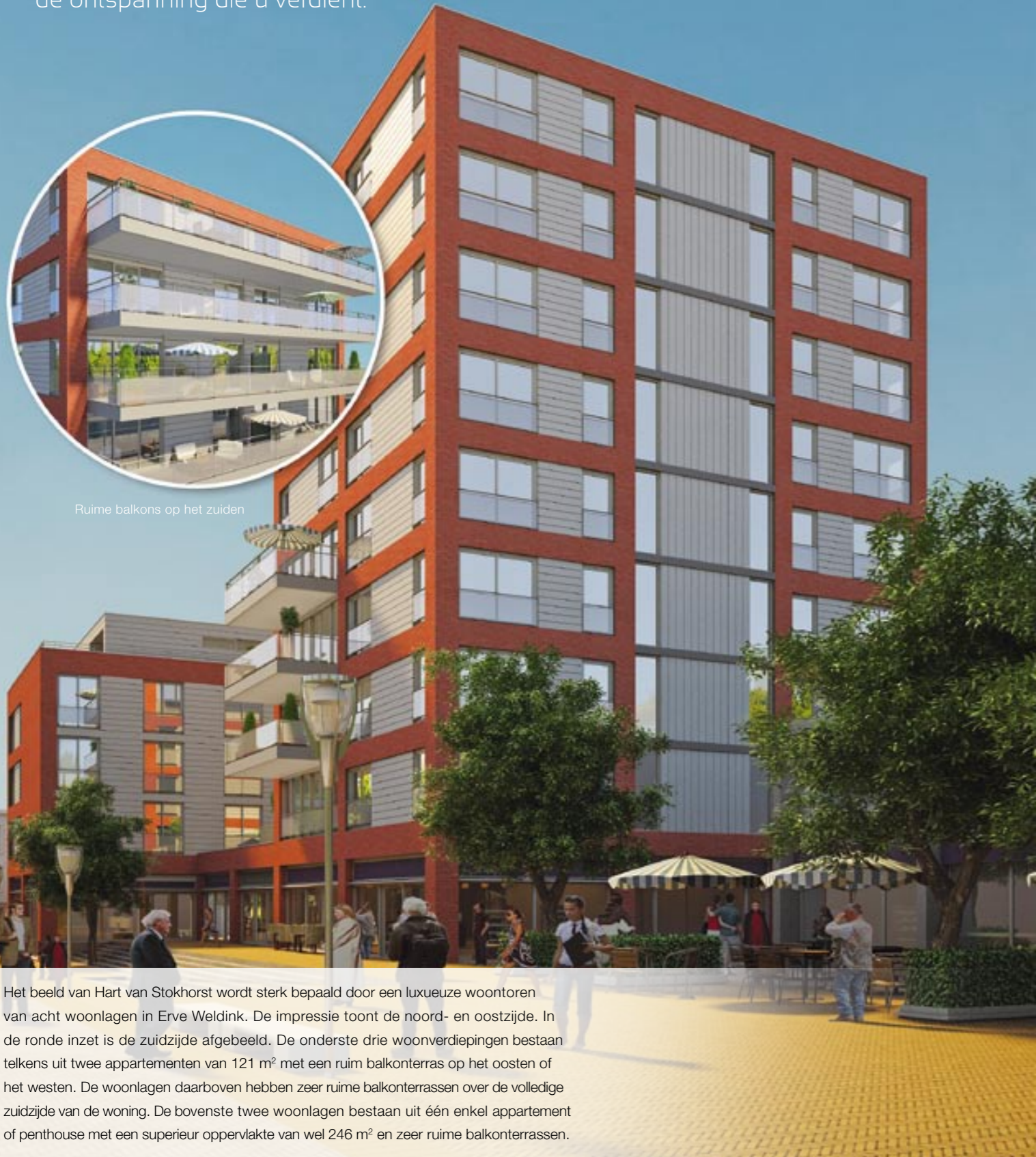
Ruime balkons op het zuiden

Stokhorst, de oostelijke rand van Enschede, waar de stad ophoudt en de groene wereld begint. Een zee van ruimte, een weldadige rust, de ontspanning die u verdient.